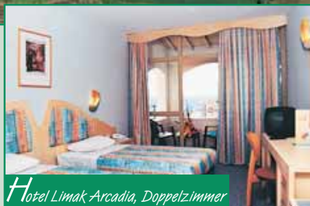
Hotel Limak Arcadia, Doppelzimmer