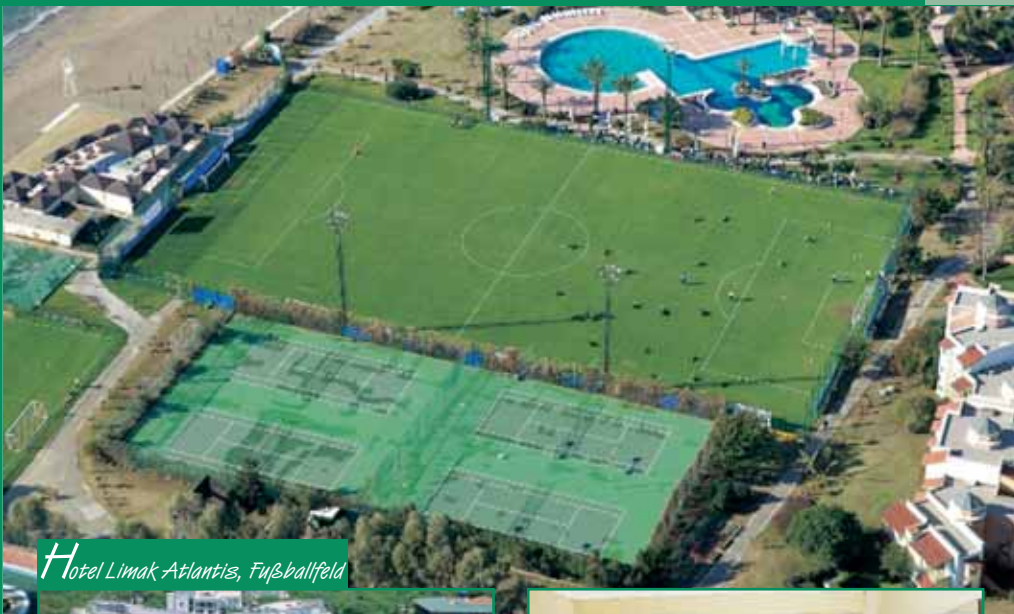
Hotel Limak Atlantis, Fußballfeld