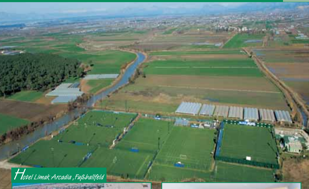
Hotel Limak Arcadia, Fußballfeld