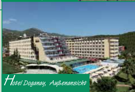
Hotel Doganay, Außenansicht