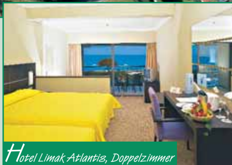
Hotel Limak Atlantis, Doppelzimmer