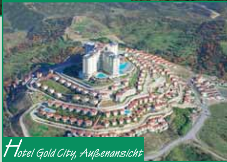
Hotel Gold City, Außenansicht