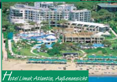
Hotel Limak Atlantis, Außenansicht