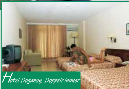
Hotel Doganay, Doppelzimmer