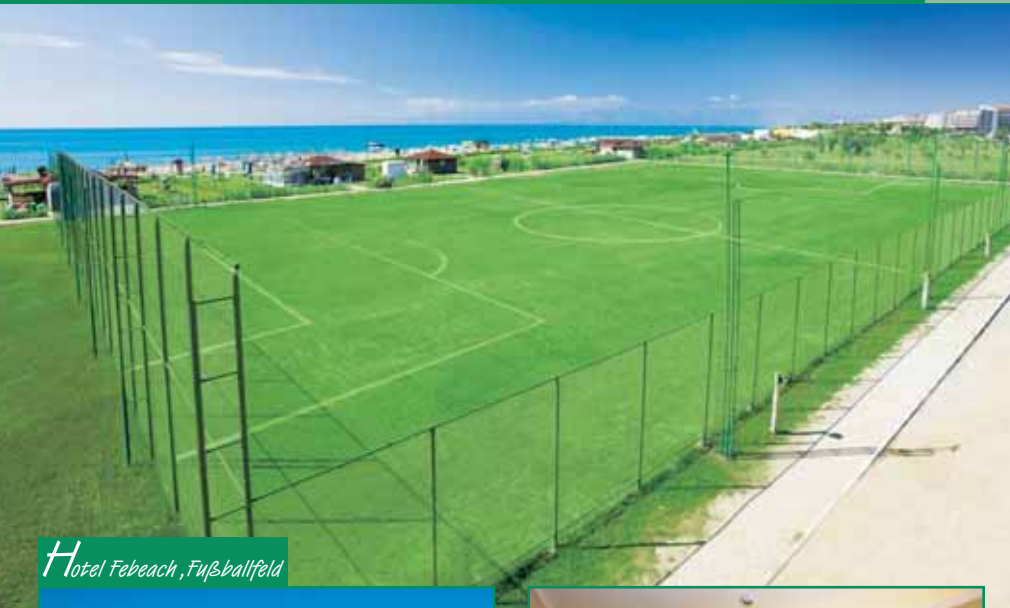
Hotel Febeach, Fußballfeld