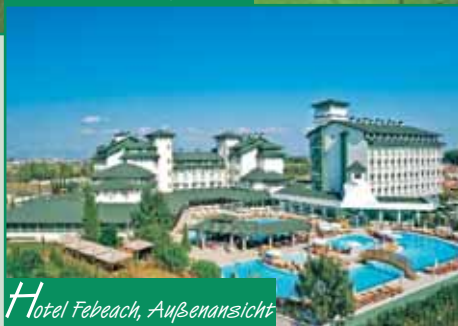
Hotel Febeach, Außenansicht