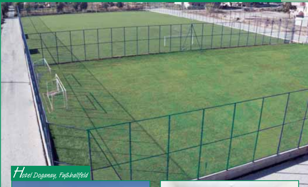
Hotel Doganay, Fußballfeld