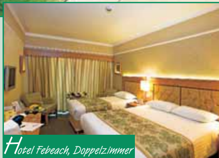
Hotel Febeach, Doppelzimmer