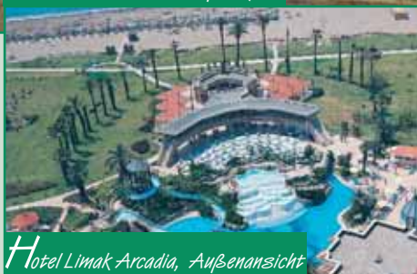
Hotel Limak Arcadia, Außenansicht