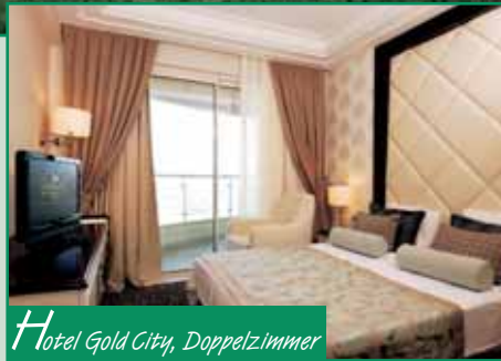
Hotel Gold City, Doppelzimmer