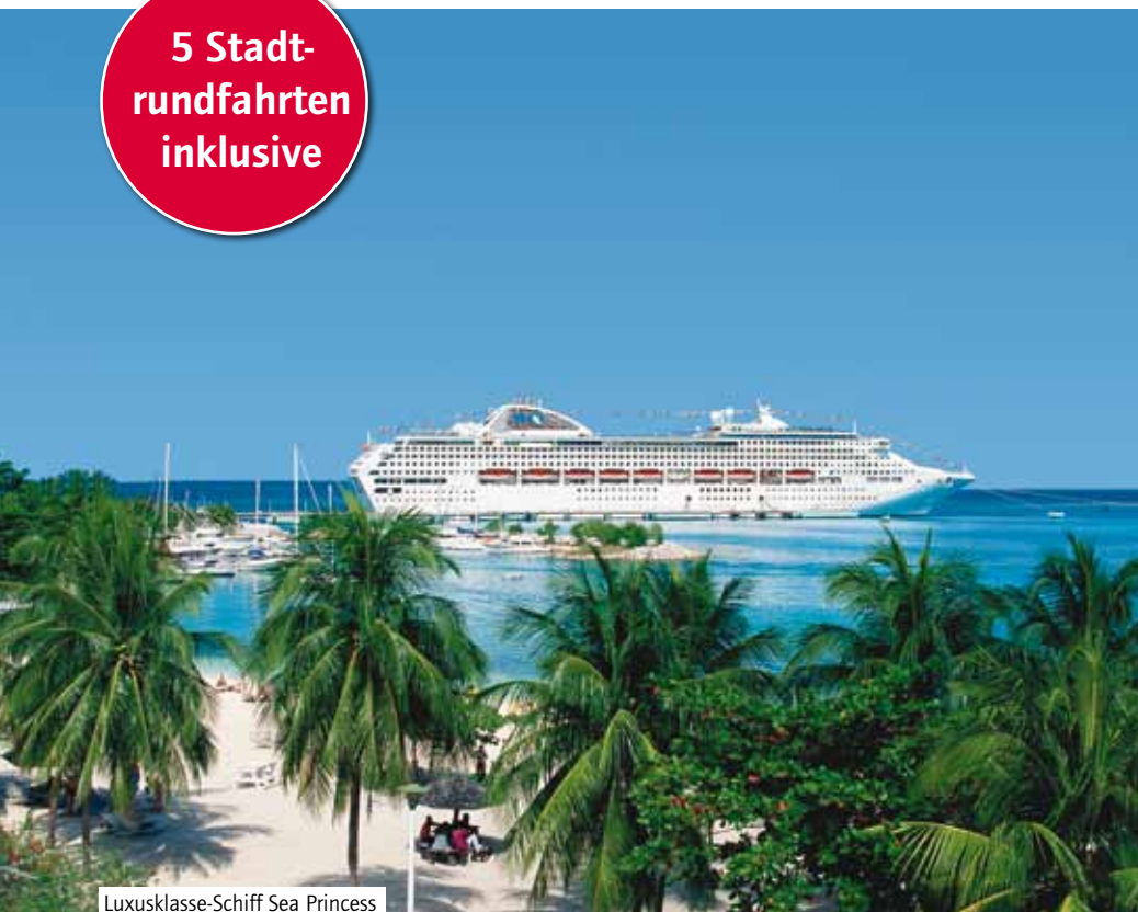
Luxusklasse-Schiff Sea Princess