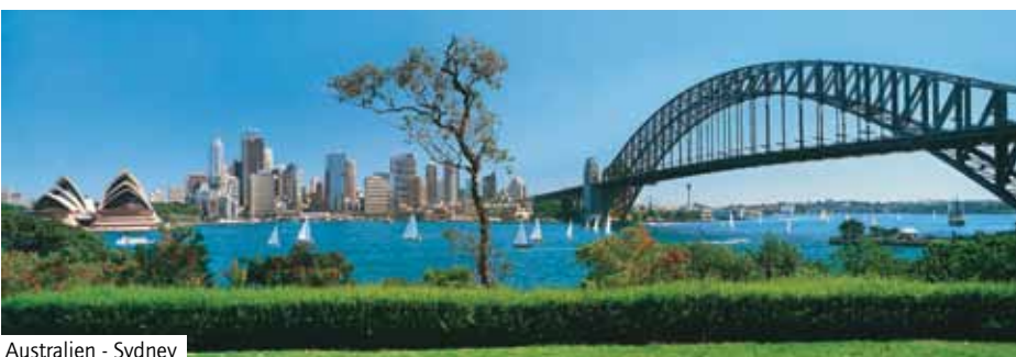
Australien - Sydney

Das Hotel liegt im Zentrum Sydneys, nur wenige Gehminuten von der Oper, dem historischen Stadtteil "The Rocks" und dem Hafengelände entfernt. Zahlreiche Restaurants und Unterhaltungsmöglichkeiten sowie Theater und Geschäfte befinden sich in der Nähe. Das Hotel bietet Restaurant, Lobby-Bar, Internetzugang (gegen Gebühr), Fitnessraum, Wäscheservice und Reinigung. Die großzügigen Doppelzimmer (ca. 30 m 2 ) sind mit Bad oder Dusche/WC, Föhn, TV, Radio, Telefon, Klimaanlage und Kaffee-/Teezubereiter ausgestattet.