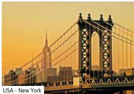
USA - New York