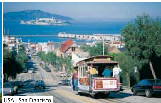
USA - San Francisco