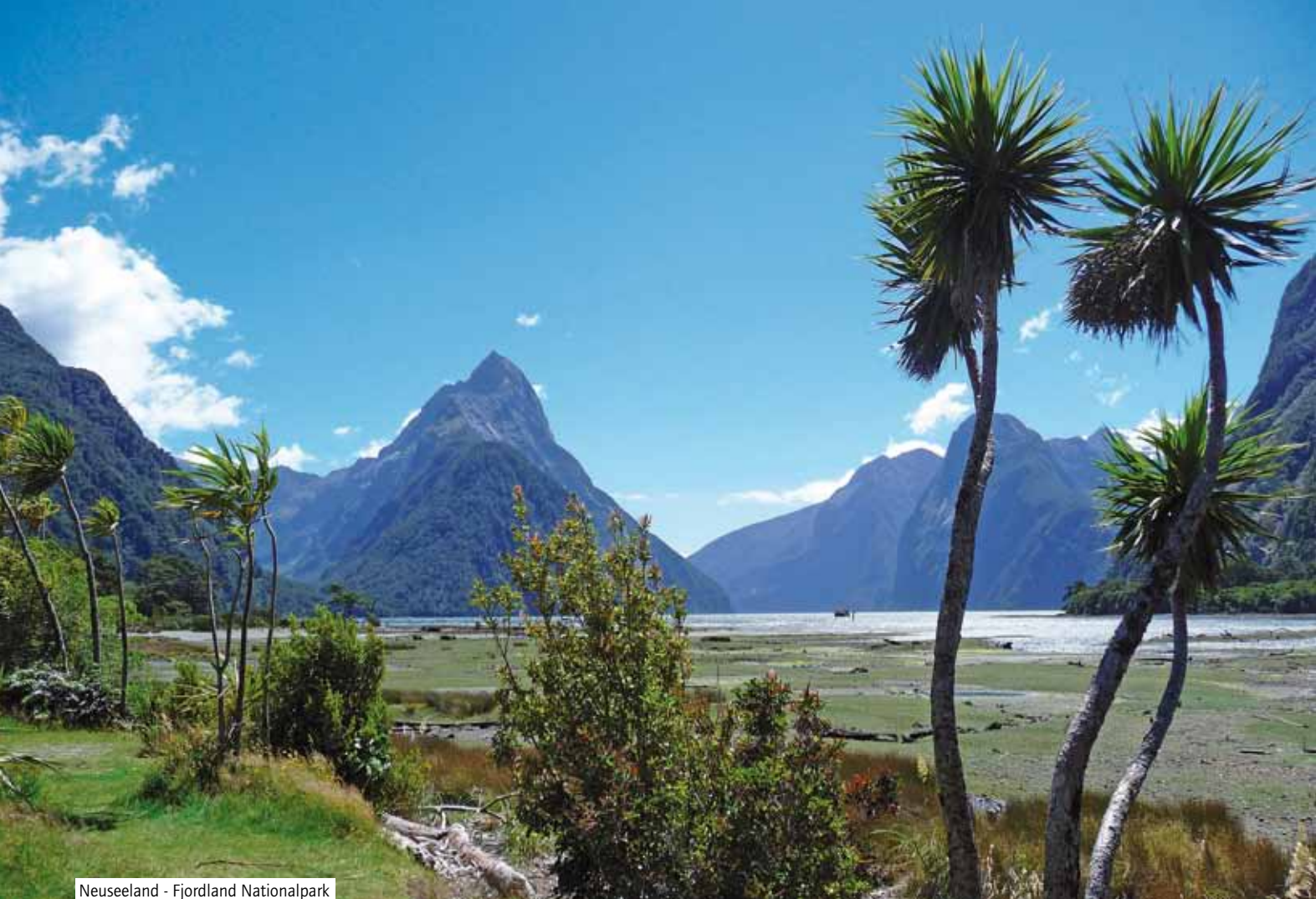
Neuseeland - Fjordland Nationalpark