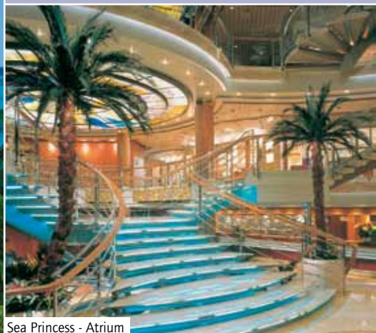
Sea Princess - Atrium

Erfüllen Sie sich Ihren Traum von einer einmaligen Weltreise und lassen Sie sich von Metropolen wie New York und der traumhaften Südsee begeistern.