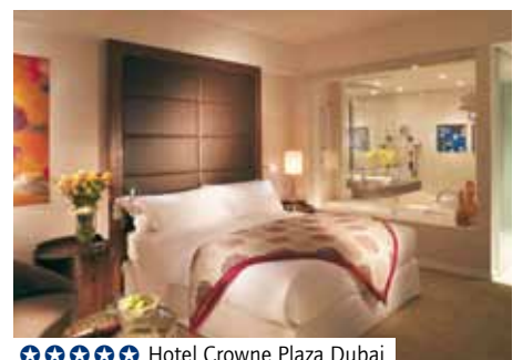
Hotel Crowne Plaza Dubai